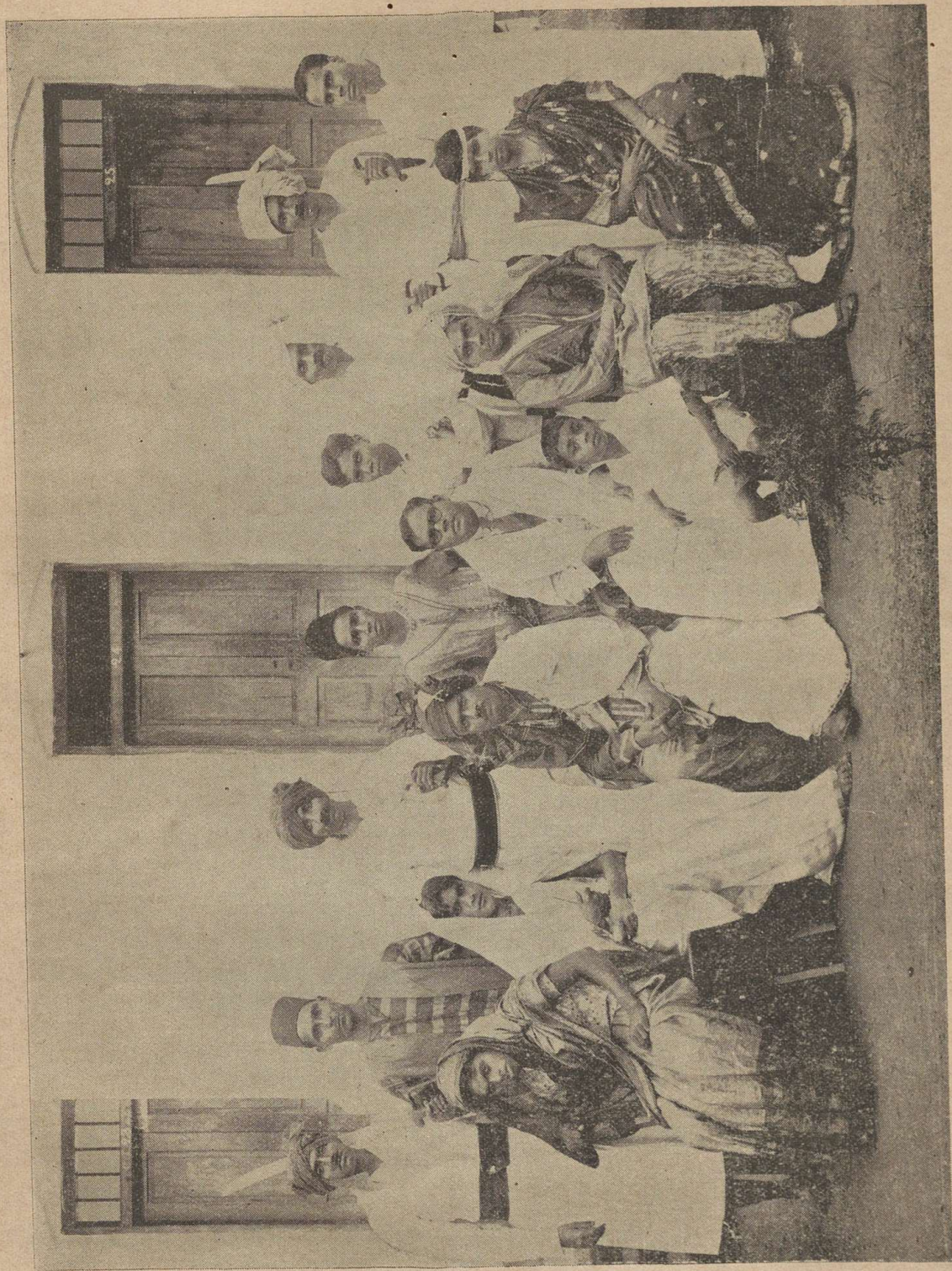
“Anarkali” (ਅਨਾਰਕਲੀ) Staged on the College Day by the College Dramatic Club.