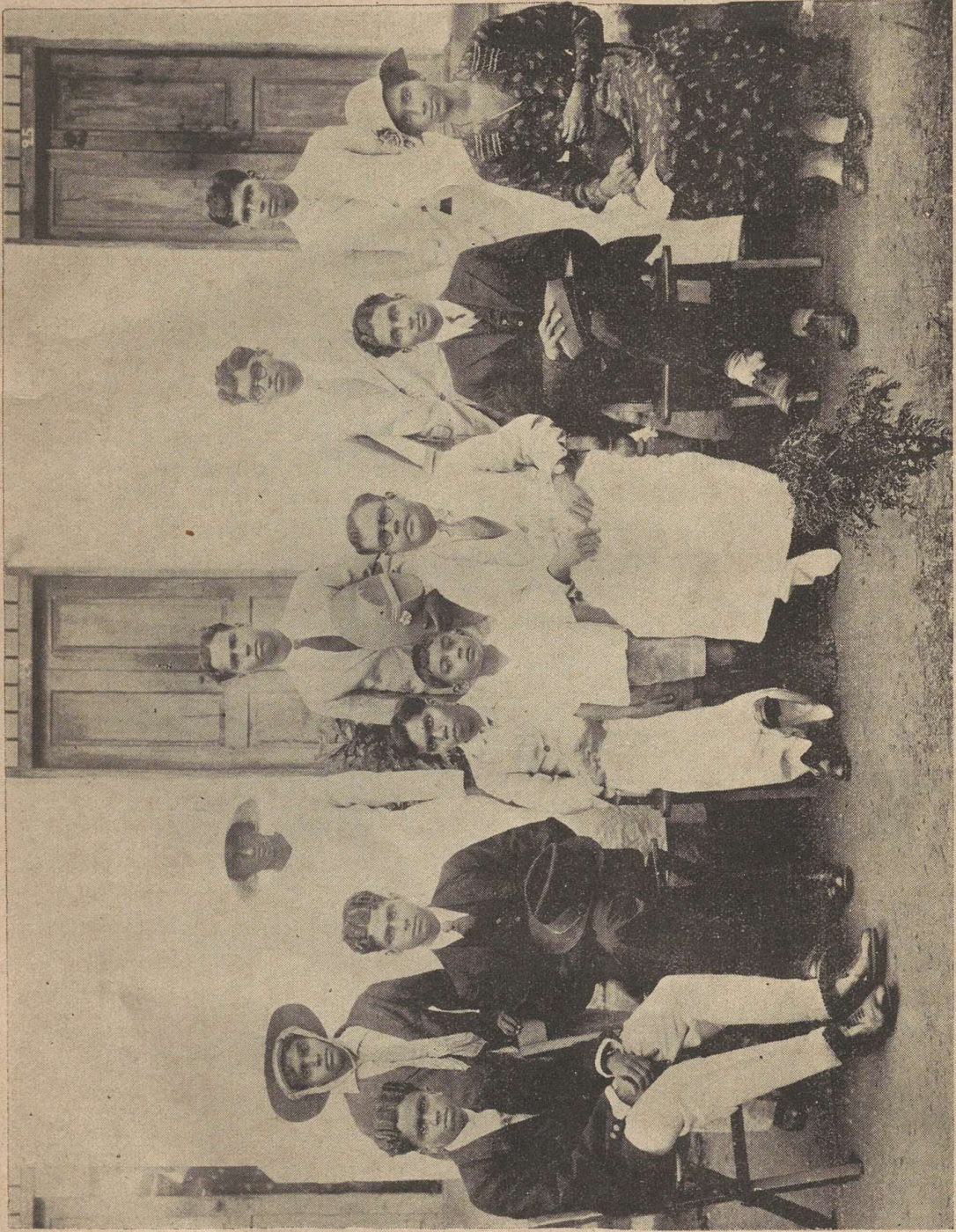
Molier's "The School for Wives" staged on the College Day by the College Dramatic Club.