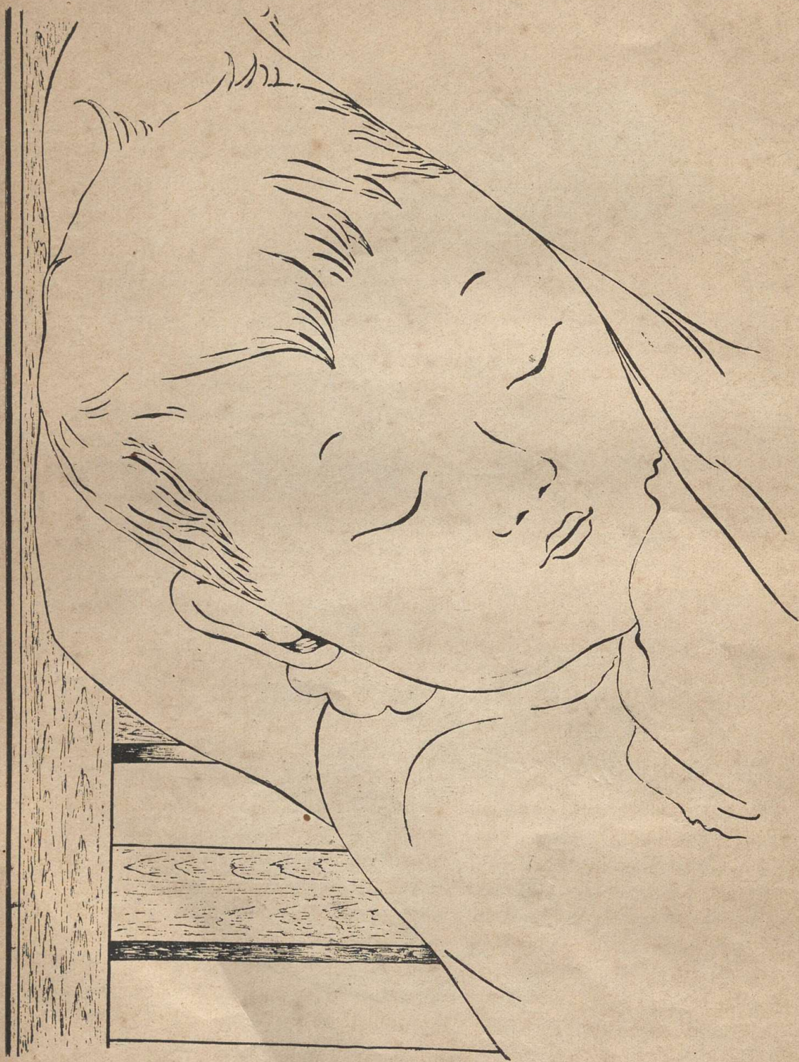
SLEEP BABY SLEEP.