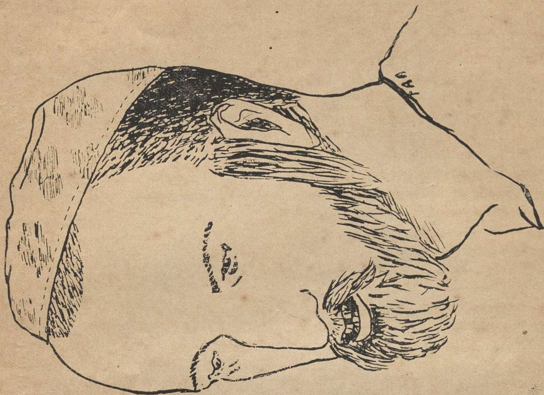
The Guileless Israelite By Mr. T. A. Abraham, Class II.