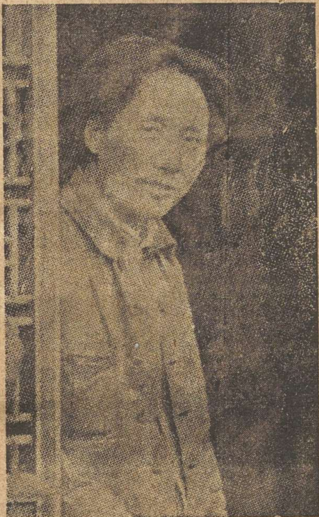
ചൈനാ കമ്മ്യൂണിസ്റ്റ് പാർട്ടി നേതാവ് സഖാവ്: മാവോ-സേ-തുങ്.