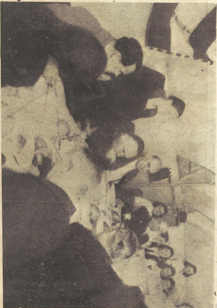
സാധുക്കളായ 17 കുട്ടികളെ ആശ്ലീതമാക്കി ക്ഷണിച്ചുവരുത്തി അവരെടുക്കി സമൂഹം ഭക്ഷണംകഴിച്ചിരുന്നു (പുറം 78)