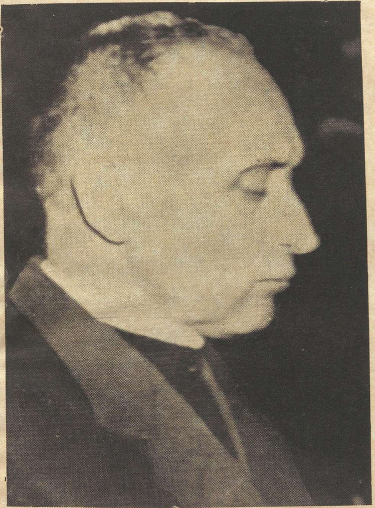
മിൻസെന്തി പ്രതിഷ്ഠയിൽ (മുതലായ പീഡാനുഭവങ്ങൾ കരളേകം)