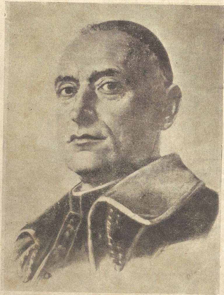
കുട്ടിനാൾ ജോസഫ് മിൻസെന്തി