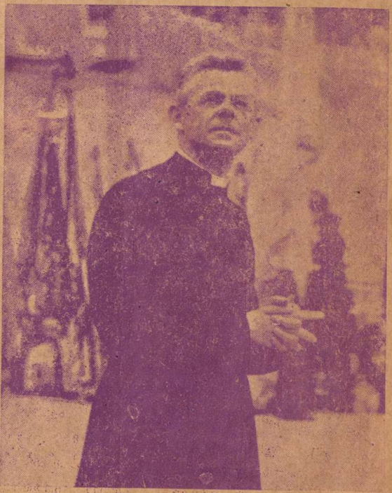
ജോസിസത്തിന്റെ ജനയിതാവ്, മൊണ്ട്. കാർഡെൻ