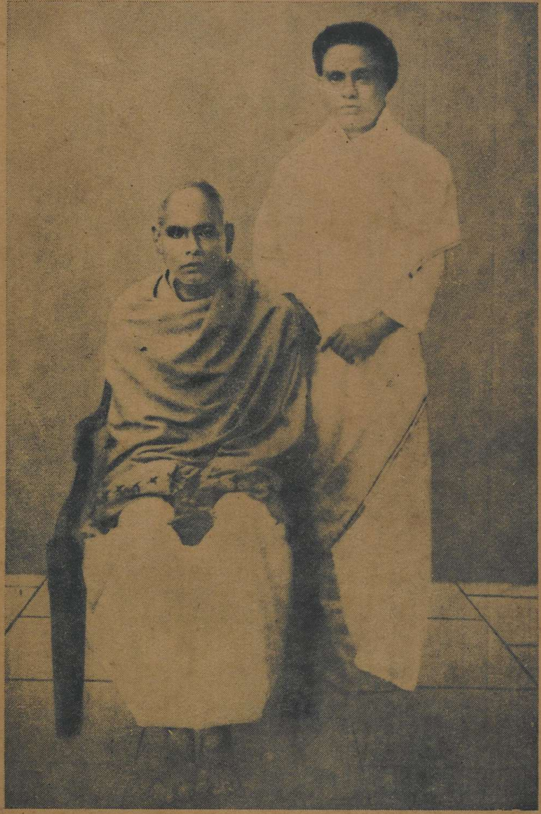
“മാതാവിൻ ചട്ടങ്ങളെ സ്വയമല്ലെങ്കിൽ മാതാമതുകളീ നീങ്ങളെത്താൻ”