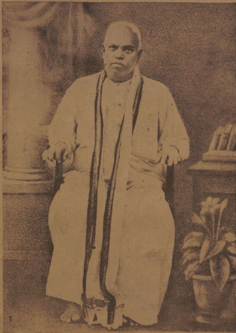
രാഹുല മതമുണ്ടുലകി,നായിരം പ്രേമം; അതൊന്നല്ലോ രക്കെ നമ്മെപ്പാലമുതട്ടും പാർവണശശിബിബം.