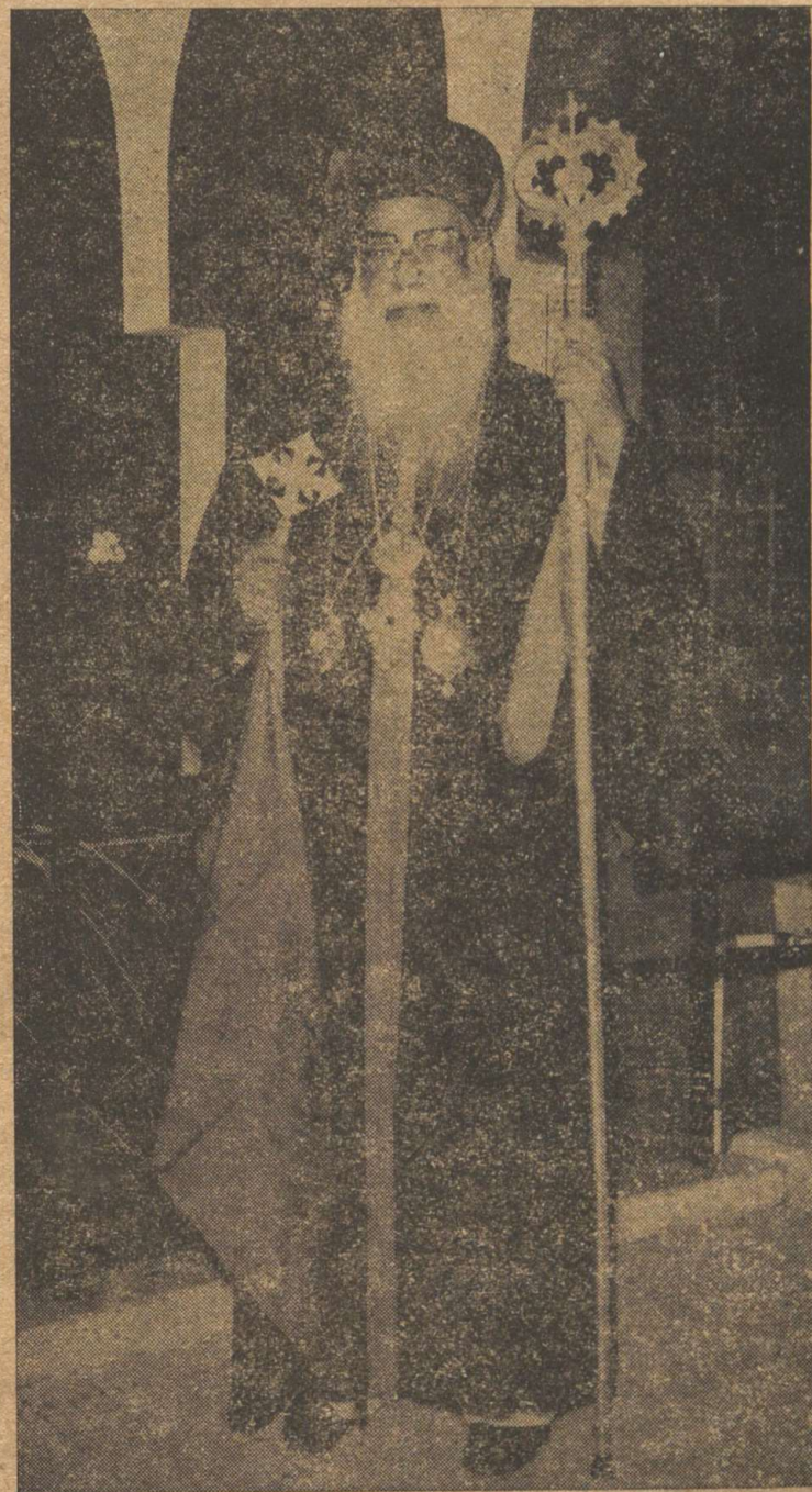
പ. ബസേലിയോസ് മർത്തോമ്മാ മാത്യൂസ് പ്രഥമൻ കാതോലിക്കാബാവ

നിലയ്ക്കൽ പള്ളിയുടെ അവശിഷ്ടങ്ങൾ 14-ാം നൂറ്റാണ്ടുവരെ അവിടെ നിലകൊണ്ടുവെന്നാണ് ചരിത്രം. അതിന് എത്രകാലം മുൻപ് ഈ കേന്ദ്രം വിട്ട് കടിയേറ്റം നടത്തി എന്നത് കൃത്യമായി പറയാൻ കഴിയില്ല. ഈ കടിയേറ്റം കാരണവും കൃത്യമായി ചരിത്രത്തിൽ രേഖപ്പെടുത്തിയിട്ടില്ലാത്തതിനാലാണ് സ്ഥാപനകാലത്തെക്കുറിച്ചുള്ള തർക്കം (ശേഷം 4-ാം പേജിൽ)