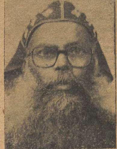
വസൂദാന കർമ്മം നിർവ്വഹിക്കുന്ന മാത്യൂസ് മാർ എപ്പിഫാനിയോസ് എപ്പിസ്കോപ്പാ.