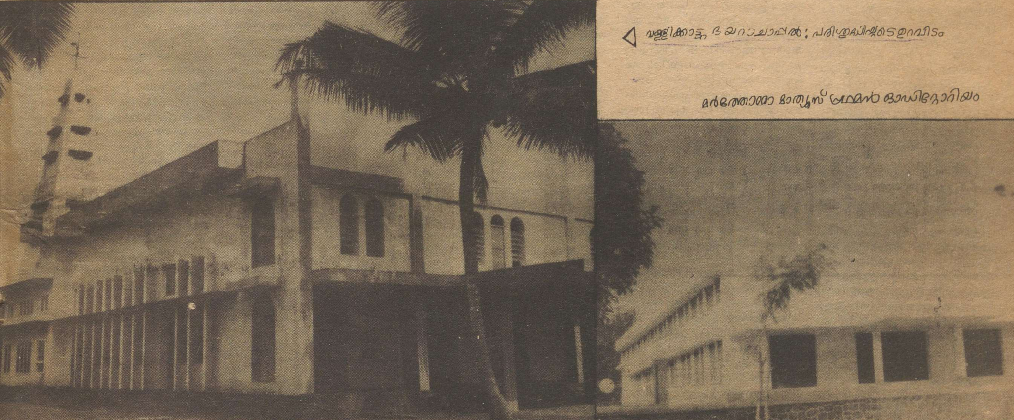
മുള്ളിക്കാട്ട്, ദുഃഖാലയം; പരിശുദ്ധിയുടെ ഉറവിടം മർത്തോമ്മാ ഭാര്യസ് പ്രഥമൻ ഓഡിറ്റോറിയം