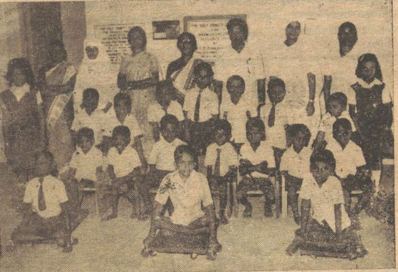
തിരുവനന്തപുരത്തെ ഹോളിട്രിനിറ്റി ബാലവേർ