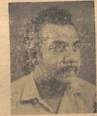
കോട്ടയം ഈ വഷം മികച്ച കവിതയ്ക്കുള്ള കക്കാട് പുരസ്കാരം കോലഞ്ചേരി സെൻ്റർ പീറ്റേഴ്സ് കോളജ് മലയാളം പ്രൊഫസർ പ്രശസ്ത (ശേഷം 6-ാം പേജിൽ)