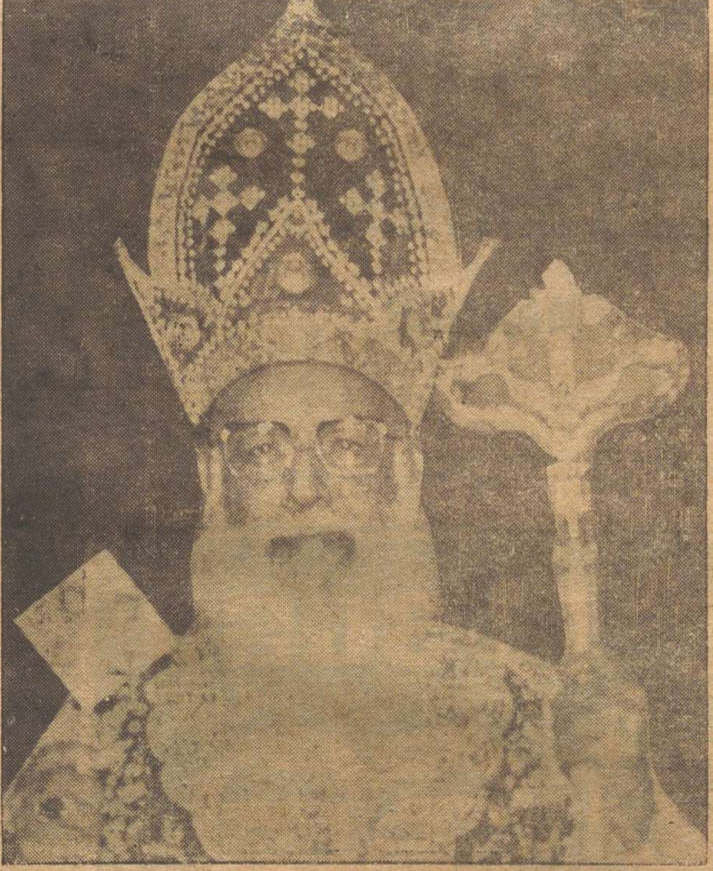
14-ാം സമാനാരോഹണ വാർഷികത്തിൽ പ. ബസേലിയോസ് മാർത്തോമ്മാ മാത്യൂസ് പ്രഥമൻ കാതോലിക്കാബാവായ്ക്ക് ഹെറാൾഡ് കുടുംബത്തിന്റെ ആശംസകൾ

35, 36 ലക്കങ്ങൾ ഒന്നിച്ചു 12 പേജാണ്. അടുത്ത ആഴ്ച പത്രം ഉണ്ടായിരിക്കുന്നതല്ല.