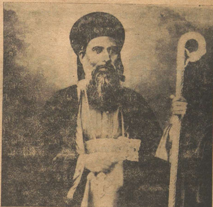
പരിശുദ്ധപരമല തിരുമേനിയുടെ 87-ാം ഓർമ്മപ്പെരുന്നാൾ പരമല സെമിനാരിയിൽ