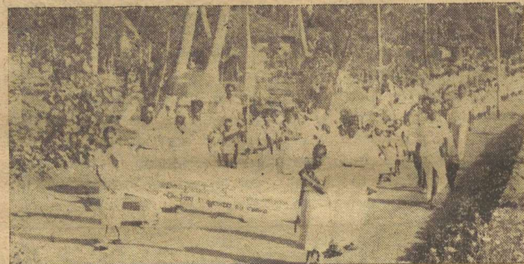
ഒ. വി. ബി. എസ്. റാലി ഒരു ദൃശ്യം