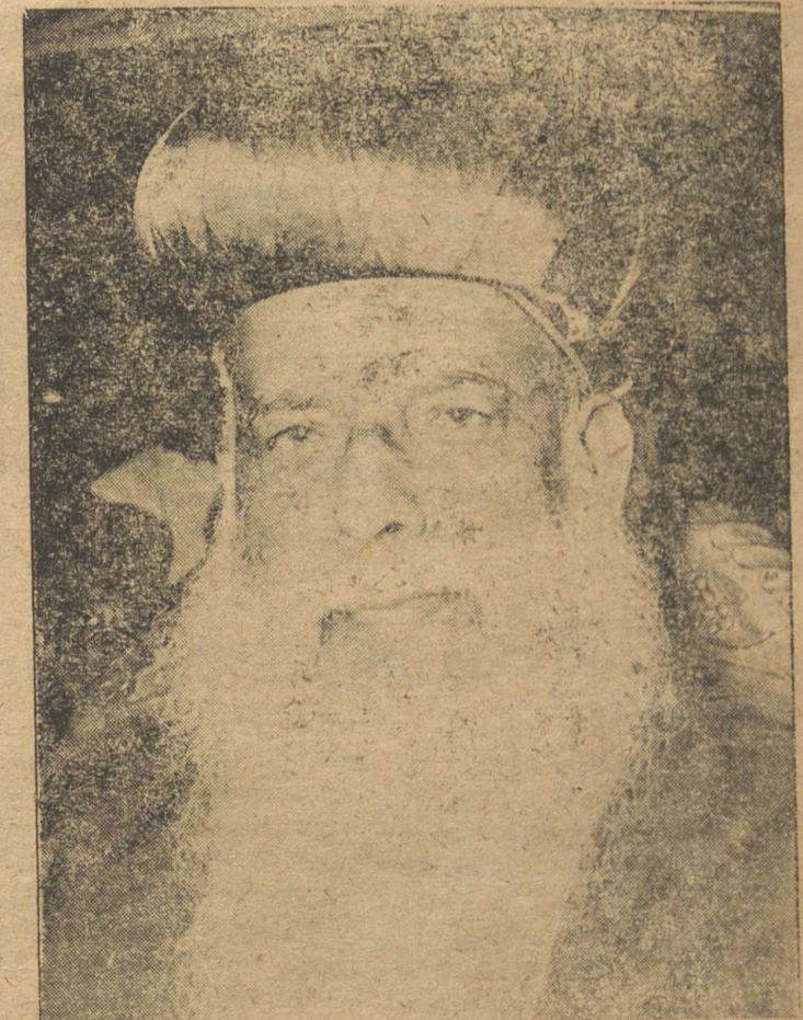
പ. ബാവായ തിരുമനസിലെ ആശംസ

വി. മൂന്നിന്മേൽകർബാനയ്ക്കു പ. ബസ്സേലിയോസ് മാർത്തോമ്മാ മാത്യൂസ് പ്രഥമൻ കാതോലിക്കാ ബാവായ തിരുമനസ്സുകൊണ്ട് പ്രധാനകാർമ്മികത്വം വഹിക്കും. കബറികളെ ധൂപപ്രാർത്ഥനകൾക്കുശേഷം നേർച്ചവിളമ്പ്. ഉച്ചകഴിഞ്ഞു 2 ന് പ്രദക്ഷിണം, ആശീർവാദം. 3 മണിക്കു ലേലവും വസൂദാനവും നടക്കും. വാക്താനം ജെ. എം. എച്ച്. എസിൽ നിന്ന് എസ്. എസ്. എൽസിക്കു ഏറ്റവും ഉയർന്നമാർക്കുവാങ്ങിയ കുട്ടികളെ സമ്മാനം രാവിലെ പ. കാതോലിക്കാബാവായ നൽകും.