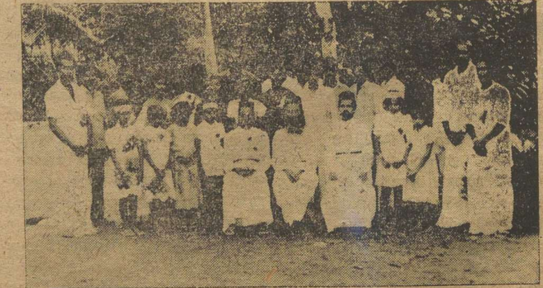
ഒ. വി. ബി. എസ്. അധ്യാപകർ ഭയറാ മനേജറോടൊപ്പം