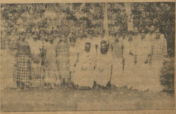
ഒ. വി. ബി. എസ്. സീനിയർ വിദ്യാർത്ഥികൾ

ചുങ്ങിയ സമയത്തെ യാത്രയായിരുന്നെങ്കിലും സുദീർഘമായ യാത്രയുടെ അനന്തരീ ഞങ്ങളിൽ ഉളവാക്കി. എന്റെ ജീവിതത്തിലെ സന്തോഷകരവും അവിസ്മരണീയവുമായ യാത്രയ്ക്കു് വഴിയൊരുക്കിത്തന്ന അച്ചനു് നന്ദി രേഖപ്പെടുത്തിക്കൊണ്ടു് ഈ യാത്രക്കുറിപ്പു് അവസാനിപ്പിക്കട്ടെ. □