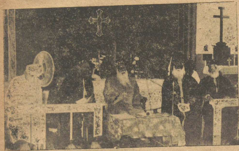
സ്ത്രീബാദാസ വാർഷിക സമ്മേളനത്തിൽ പ. ബാവ ഓഫീസറുടെ പ്രസംഗം ചെയ്യുന്നു