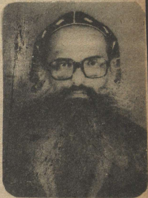
വ. ഐ. ശ്രീ. ബർസുമാ റമ്പാൻ, മാർബസേലിയേഴ്സ് ഓഫ്, ഞാലിയാക്ഷി; കോട്ടയം നാലുനാക്കൽ മാർഗ്രിഗോറിയോസ്