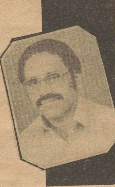
കേരളത്തിലെ ഇതരപ്രദേശങ്ങളെ അപേക്ഷിച്ച് നോക്കിയാൽ സുവിശേഷപ്രവർത്തനങ്ങൾ ധാരാളം നടന്നിട്ടുള്ള ഒരു പ്രദേശമാണ് പത്തനംതിട്ട. സുവിശേഷ സന്ദേശം ഉൾക്കൊള്ളുന്ന ഒരു ആത്മീയ സംസ്കാരമാണ്

സമൃദ്ധവുമായ പത്തനംതിട്ട സഹ്യപർവ്വതനിരകളെ തൊട്ടുരുമ്മി നിൽക്കുന്നു. കാട്ടുരാജാക്കന്മാരുടെ വീരശൂര പരാക്രമങ്ങൾ നേരിൽ കണ്ടിട്ടുള്ള ഈ പ്രദേശത്ത് നൂറ്റാണ്ടുകൾ പഴക്കമുള്ള ഒരു സംസ്കാരത്തിന്റെ അവശിഷ്ടങ്ങൾ മറഞ്ഞുകിടക്കുന്നു. ചരിത്രാനുസ്മിതികൾക്ക് ജീജ്ഞാസ പകരുന്ന മണ്ണാണിത്. ഇരുപത്തിരണ്ടു ലക്ഷത്തി അമ്പത്തിനാലായിരത്തി ഇരുനൂറ്റി ഇരുപത്തിരണ്ടിൽപരം ജനങ്ങൾ ഇവിടെ ചിതറിപ്പാർക്കുന്നു. കോളേജുകൾ ഉൾപ്പെടെ നിരവധി വിദ്യാലയങ്ങൾ ഈ പ്രദേശത്ത് അവിടവിടെയായി തലയുയർത്തി നിൽക്കുന്നു. ഹൈന്ദവ-ക്രൈസ്തവ-മുസ്ലീം ദേവാലയങ്ങൾ തൊട്ടുരുമ്മി നിൽക്കുന്ന ഈ പ്രദേശം മതസൗഹൃദത്തിന്റെ പ്രതീകമത്രെ.