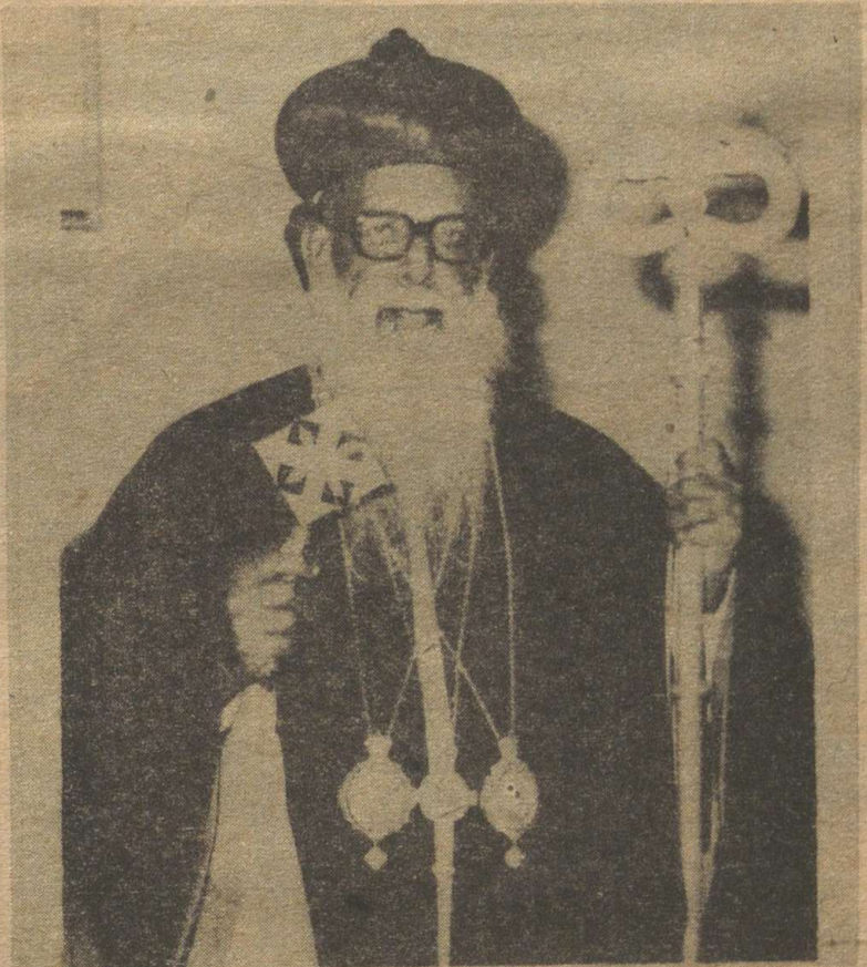
യോഗത്തിന്റെ അദ്ധ്യക്ഷൻ; മലങ്കരമെത്രാപ്പോലീത്തായും കാതോലിക്കായുമായ പരിശുദ്ധ ബസേലിയോസ് മാർത്തോമ്മാ മാത്യസ് പ്രഥമൻ ബാവ

മലങ്കര മെത്രാപ്പോലീത്തായായ പരിശുദ്ധ ബസേലിയോസ് മാർത്തോമ്മാ മാത്യസ് പ്രഥമൻ കാതോലിക്കാ ബാവ 1 മണിക്ക് സമ്മേളനപ്പന്തലിലേയ്