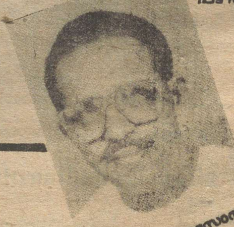
അസോസിയേഷൻ നെട്ടൂറി പോംമത്തായി.