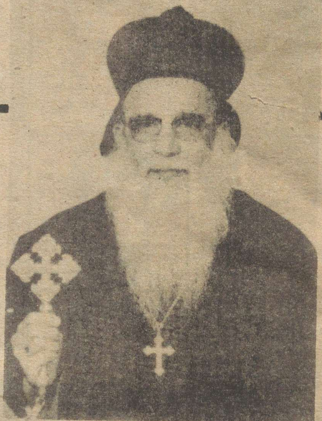
നിയുക്ത കാതോലിക്കാ മാത്യുസ് മാർ കൂറി ലോസ് മെത്രാപ്പോലീത്താ