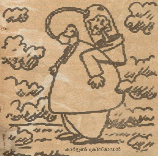
കാർട്ടൂൺ : ക്രിസ്മാഡൻ