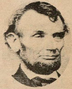
ലാളിത്യം സന്ധം വരിച്ച മഹാനായിരുന്ന എബ്രഹാം ലിങ്ക്ൺ