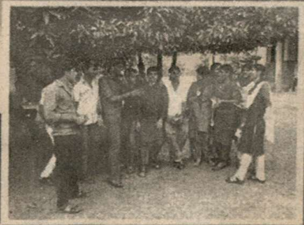
ലിറ്റിൽ മാസികയുടെ നെൽകൃഷി സംരംഭത്തിൽനിന്ന് ഒരു ദൃശ്യം. ചുങ്കത്തറ കുറ്റിമുണ്ടയിലെ കൃഷിയിടത്തിൽനിന്ന്.