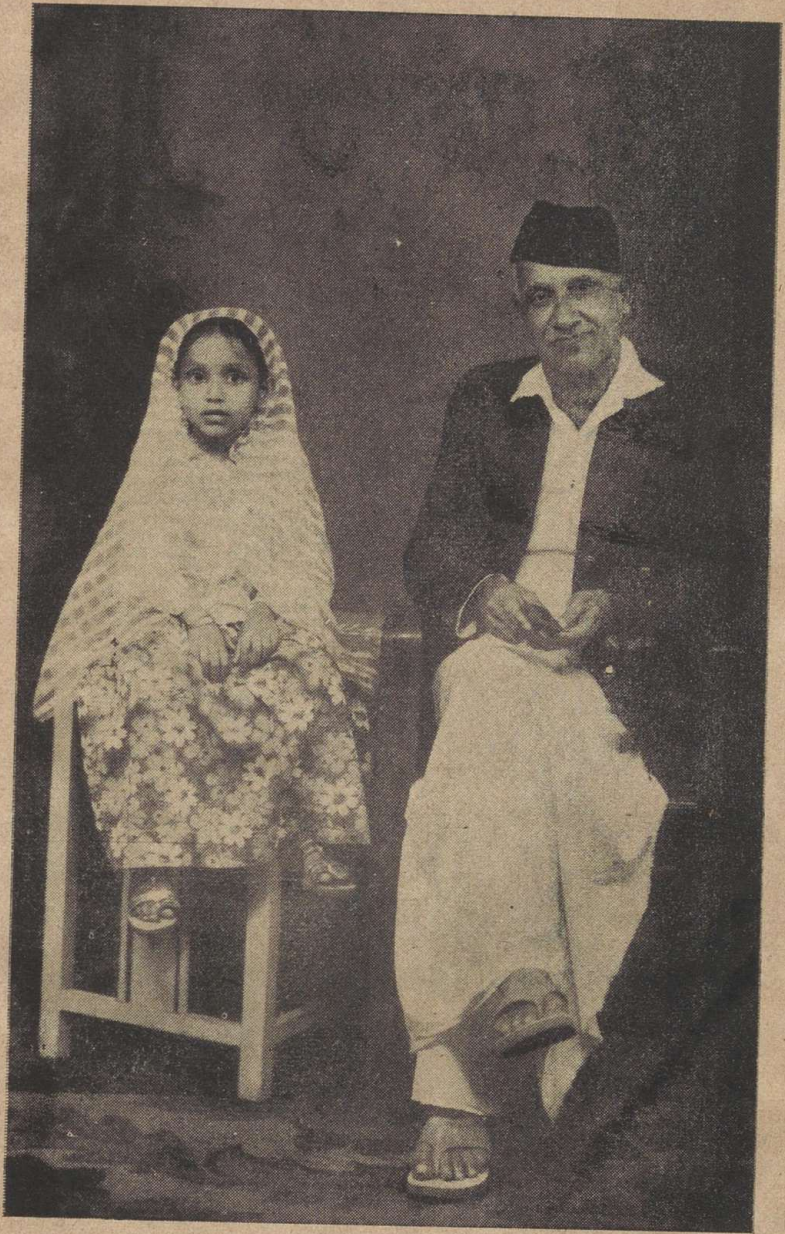
ഗ്രന്ഥകർത്താവു. അദ്ദേഹത്തിന്റെ ജീവിത സമൃദ്ധവും മാതൃരഹിതയുമായ ഏകാന്തി ബീബിയും.